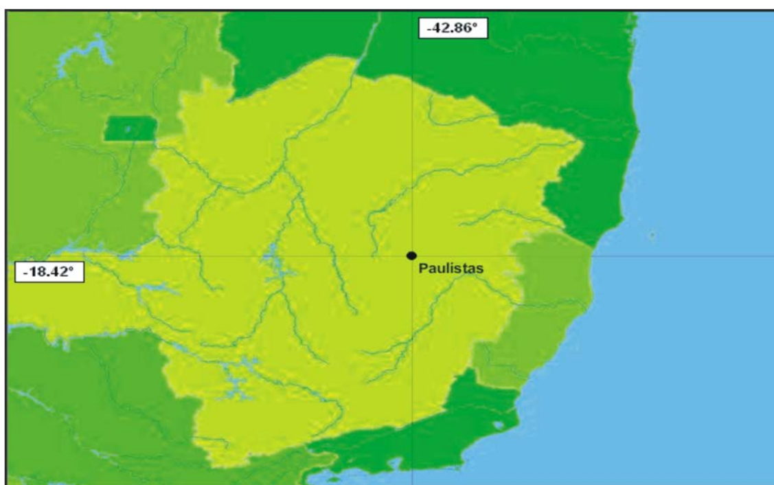
Figura 1 - Localização geográfica do município de Paulistas – Minas Gerais.

Possui uma extensão territorial de 221 km 2 e 4.918 habitantes, dos quais 2.615 vivem na zona rural. Limita com os municípios de Coluna, Materlândia, Sabinópolis, São João Evangelista e Rio Vermelho (IBGE, 2011).