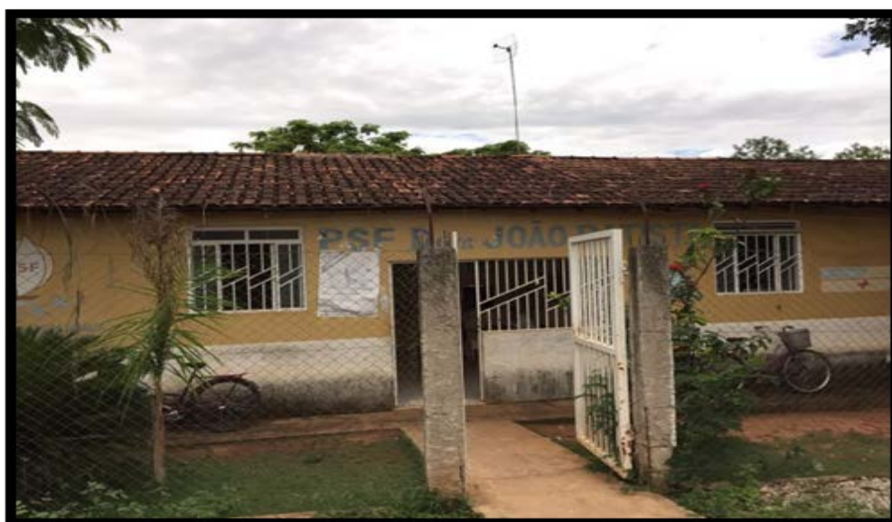
Figura 1- Sede da UBS Boa Vista, município de Januária/MG.

Sua sede dista cerca de 2km do centro do município, sendo, predominantemente, urbana, apesar de haver um trecho não urbanizado separando-a do restante do município (saída para o município de Itacarambi/MG).