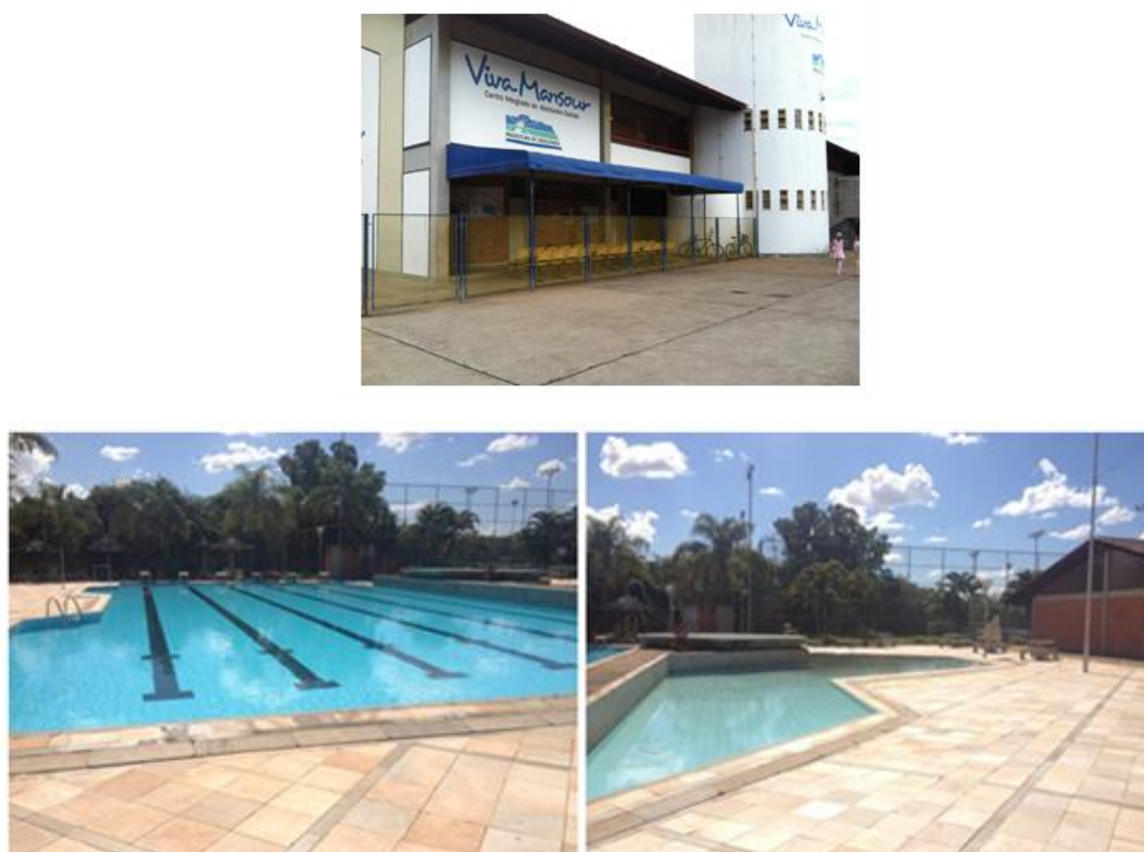
Figura 1. Área externa do Complexo Viva Mansour, Uberlândia/MG, 2013.

O projeto Viva Mansour é uma parceria entre a Prefeitura de Uberlândia e o SESI/FIEMG que atende à comunidade desde agosto de 2007. Neste local, são realizadas ações culturais promovidas pela Secretaria Municipal de Cultura com o objetivo de proporcionar aos moradores do bairro Mansour e bairros circunvizinhos a oportunidade de participarem de oficinas de artes sem custo, com boa qualidade e, assim, serem agentes transformadores da comunidade por meio das atividades oferecidas visando à formação de cidadãos com desenvolvimento do equilíbrio, autoestima e socialização (PREFEITURA DE UBERLANDIA, 2013).