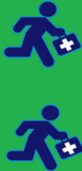
Treinamento prático supervisionado NHS* 2 anos

* National Health System, Sistema Nacional de Saúde