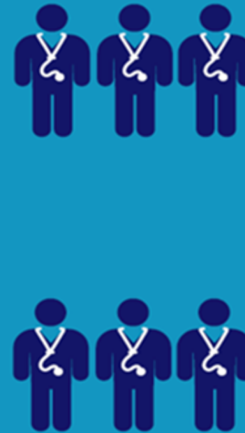
Treinamento na Especialidade médica 3 a 8 anos

* National Health System, Sistema Nacional de Saúde