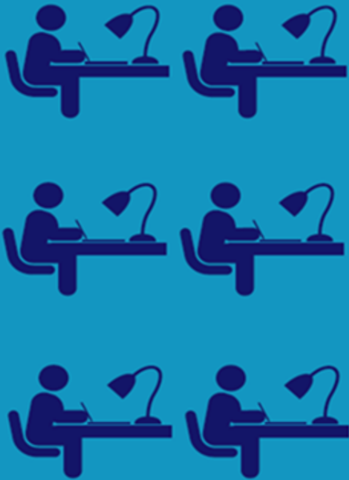
Graduação em medicina