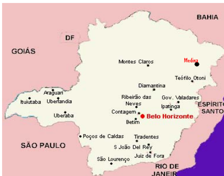
Fig. 1 – Mapa do Estado de Minas Gerais com localização do município de Medina.

Hoje o município possui 20.732 habitantes (Fig.2), observa-se que 14,51% da população tem mais de 60 anos, sendo essa proporção superior a do Brasil (11%) e Minas Gerais (11,90%) (IBGE, Censo 2010).