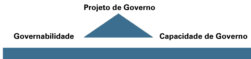
Figura 1 - Triângulo do Governo

A análise sobre o "equilíbrio" entre os três vértices do triângulo permite avaliar quais são os "pontos fracos" de um processo de gestão, orientando, com mais clareza, o processo de tomada de decisões sobre as intervenções necessárias. Isto é, se é preciso definir melhor o projeto e/ou se é preciso aumentar a governabilidade e/ou a capacidade de governo .