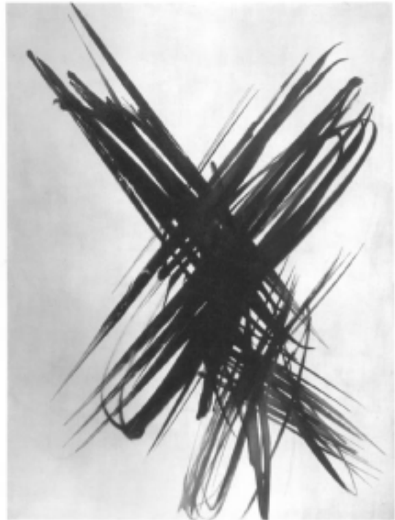
HANS HARTUNG, T 1956/7, 1956/7

Para tanto, reconhece-se, ainda, a necessidade da transformação da relação profissional-usuário para a construção de um modelo assistencial alternativo, capaz de acumular experiências contra-hegemônicas. Paim (2002, p. 363) pondera que “apesar da relevância da implantação do PSF faltam, contudo, evidências que apontem esse programa como estratégia suficientemente eficaz para a reorientação dos modelos assistenciais dominantes” . Nesta empreitada, é fundamental a reformulação dos discursos e das racionalidades subjacentes.